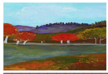
Œuvre de Marc LeBlanc, présentée lors du colloque L'art de me faire entendre , avril 2010.

Usagers, parents ou représentants, nous vous invitons à nous faire connaître un usager du CRDI, envoyez-nous un petit texte que nous publierons dans notre prochain numéro.